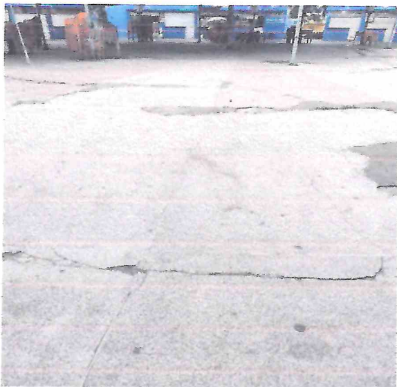
Foto 09 – Remoção do piso polido da área dos quiosques. Execução de novo piso em concreto polido.