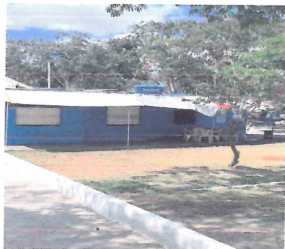
Foto 16 – Área externa dos quiosques. Demolição e execução de novos quiosques.