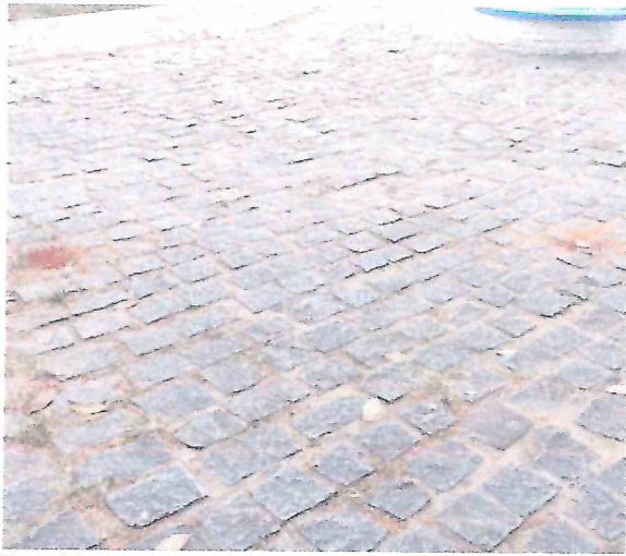
Foto 11 – Remoção de paralelepípedo. Execução em piso sextavado próximo a fonte luminosa, que será removida para execução de fonte interativa.