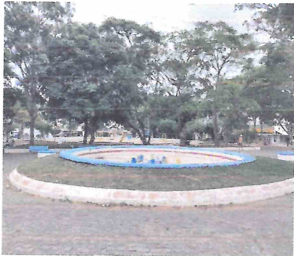
Foto 13 – Remoção de paralelepípedo. Execução em piso sextavado próximo a fonte luminosa, que será removida para execução de fonte interativa.