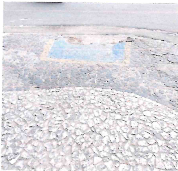
Foto 01 – Remoção das rampas de acessibilidade para execução dentro das normas técnicas.