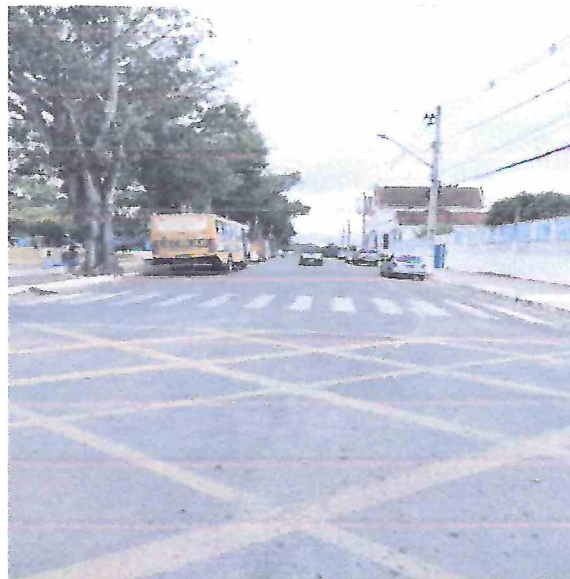
Foto 20 – Elevação de piso para execução de calçada compartilhada, executada em piso intertravado retangular.