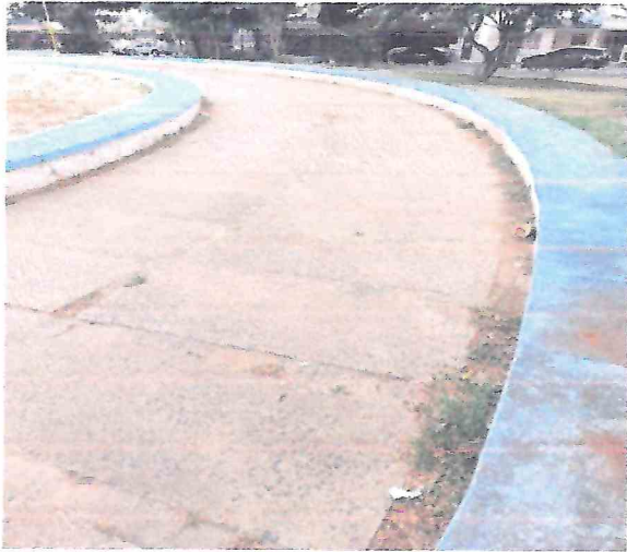
Foto 05 – Demolição e remoção das placas de concreto e bancos. Execução de concreto polido para atividades e esportes.