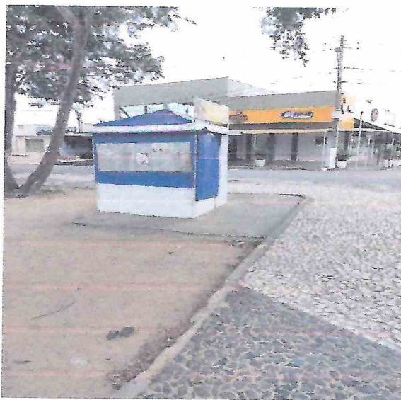
Foto 02 – Remoção da pedra portuguesa, execução de intertravado e concreto para pista de caminhada. Execução de quiosque após remoção da barraca para venda de acarajé.