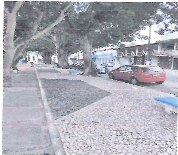
Foto 12 – Remoção de pedra portuguesa e retirada de meio fio. Reassentamento de meio fio com novo alinhamento para execução de área para vagas de motos entre os canteiros.