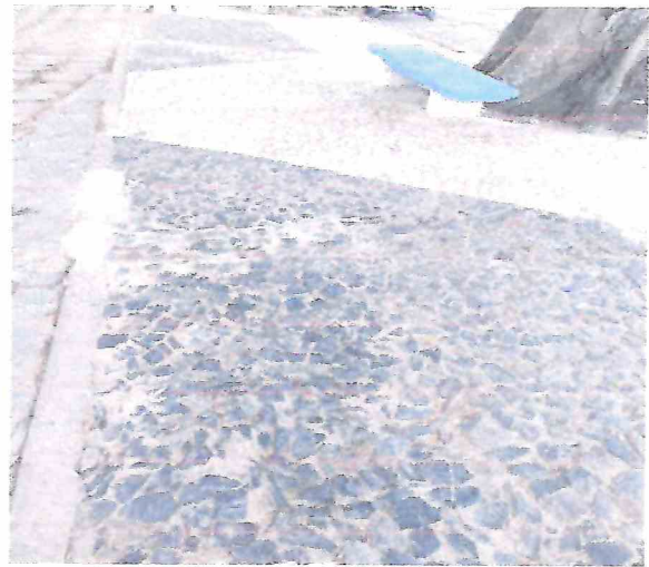
Foto 06 – Remoção de pedra portuguesa em todo perímetro da praça. Nova área de circulação executada com passeios em intertravado formato raquete.