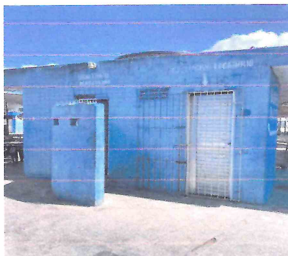
Foto 18 – Banheiros a serem demolidos. Execução de novos banheiros com instalações novas.