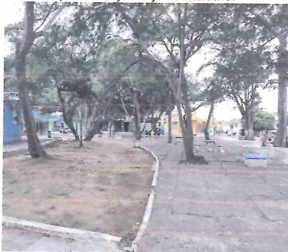
Foto 15 – Área de canteiro a ser aplicado grama. Remoção de piso antigo para execução de novos pisos.