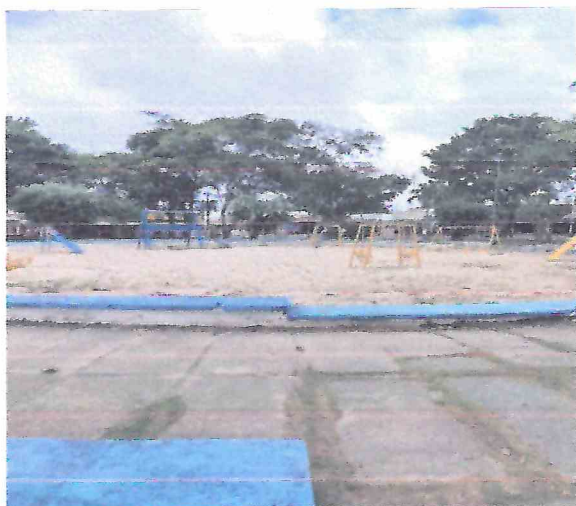
Foto 17 – Área do parque a ser instalado um novo conjunto de brinquedos com grama sintética e cercas em eucalipto.