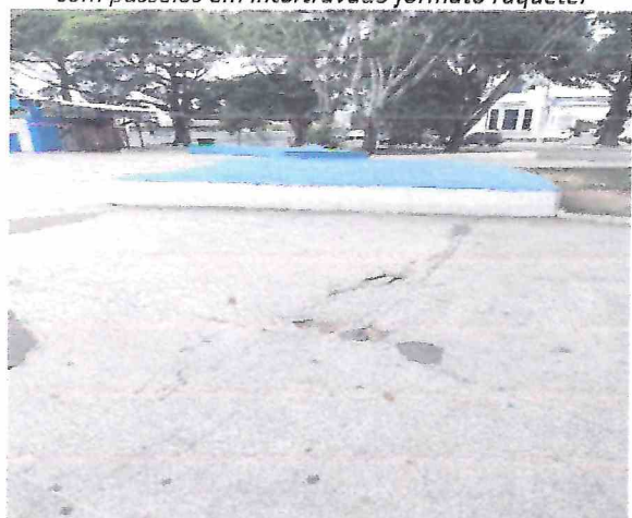
Foto 08 – Remoção do palco e demolição em piso de concreto. Execução de novo palco locado mais centralizado e novo piso em concreto polido.