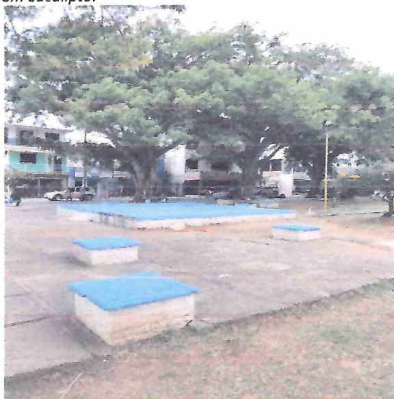
Foto 19 – Remoção de bancos em concreto. Execução de DOG PARK. Área para animais.