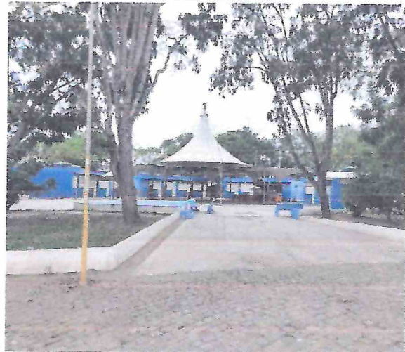
Foto 14 – Área interna dos quiosques. Execução de novo piso em concreto e reforma geral dos quiosques.