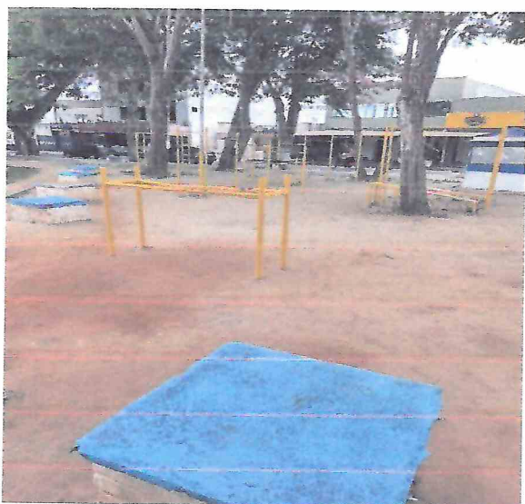
Foto 03 – Remoção dos equipamentos de ginástica, instalação em área única e maior. Execução da pista em concreto para caminhada, pergolado e piso intertravado no local.