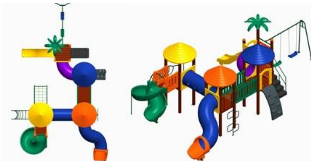
Imagem meramente ilustrativa. (Aparência aproximada do item)