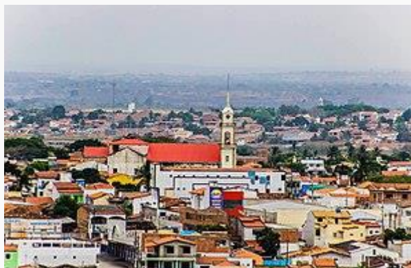
Vista panorâmica de parte do centro da cidade.