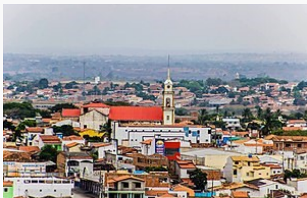
Vista panorâmica de parte do centro da cidade.